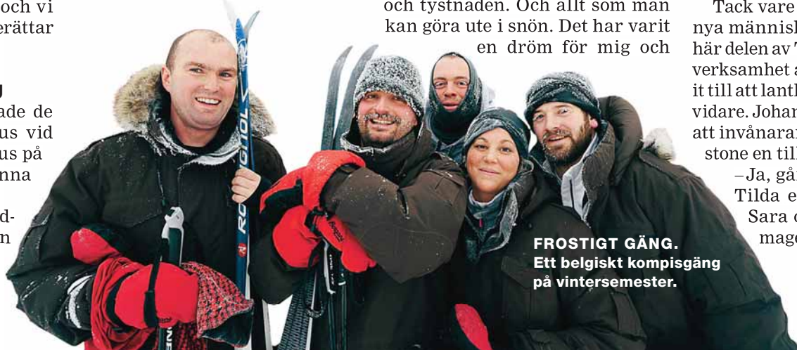
FROSTIGT GÅNG. Ett belgiskt kompisgäng på vintersemester.