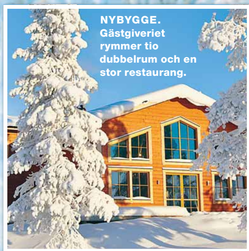
NYBYGGE. Gästgiveriet rymmer tio dubbelrum och en stor restaurang.