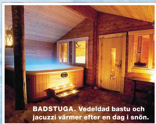
BADSTUGA. Vedeldad bastu och jacuzzi värmer efter en dag i snön.